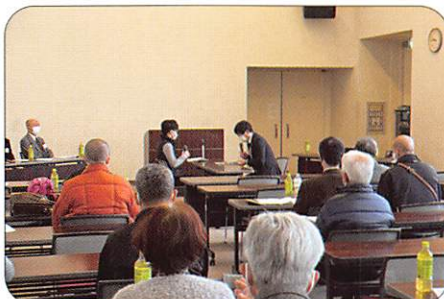
2月16日 至近就任保護司研修会 【更生保護サポートセンターふくやま】