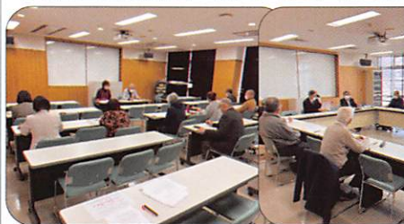
3月4日 5専門部会 【更生保護サポートセンターふくやま】