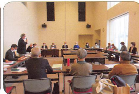
2月7日 更生保護女性会との交流会 【更生保護サポートセンターふくやま】