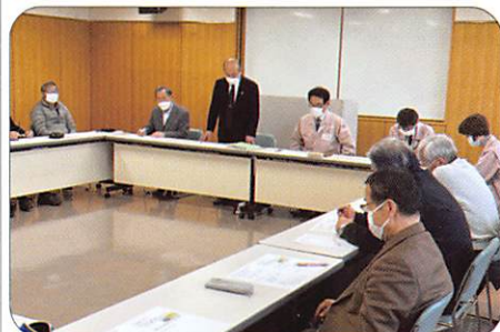
2月13日 福山市青少年女性活躍推進課との交流会 【サボセンふくやま】