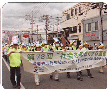
5月28日 福山ばら祭り ローズパレード