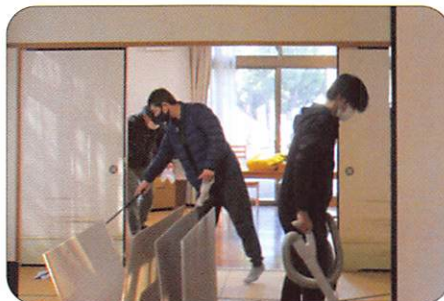
1月11日 社会貢献活動 【指定障害福祉サービス事業所青葉】