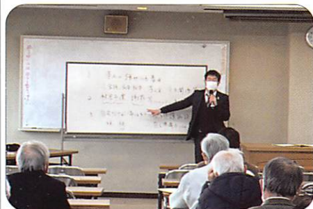
12月7日19日23日 地域別定例研修 【福山市民参画センター】