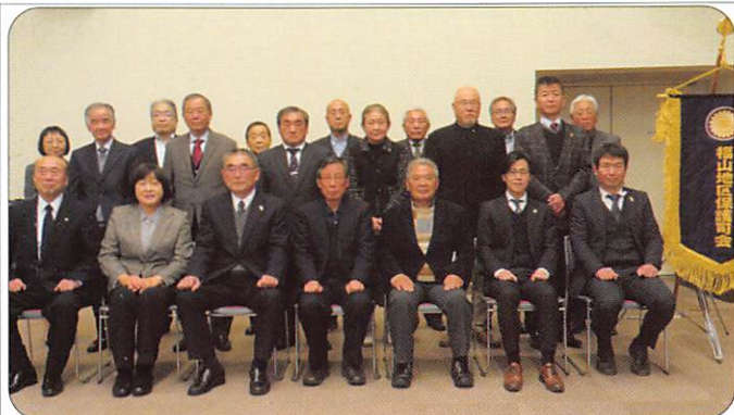
12月15日 退任保護司との協議会 【更生保護サポートセンターふくやま】