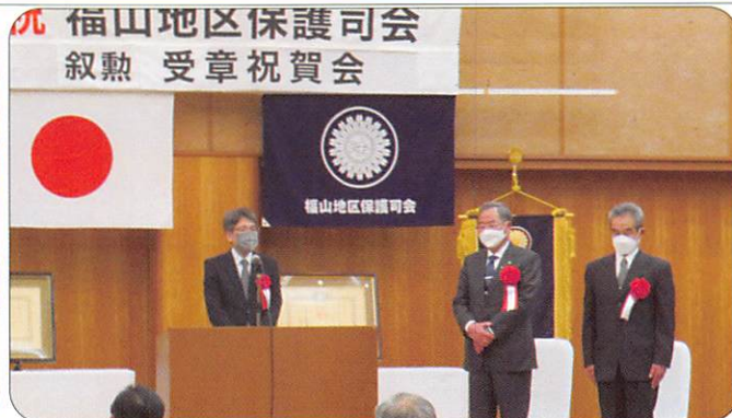
3月10日 叙勲受章祝賀会 【福山労働会館みやび】