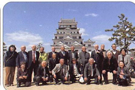
3月28日 保護司OB会 【福山城】